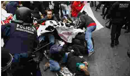
Manifestacions antifeixistes reprimides per la policia l'any 2008

Convocatòria unitària contra la concentració dels feixistes a Montjuïc. L'esquerra independentista engega, a més, una campanya pròpia antifeixista.